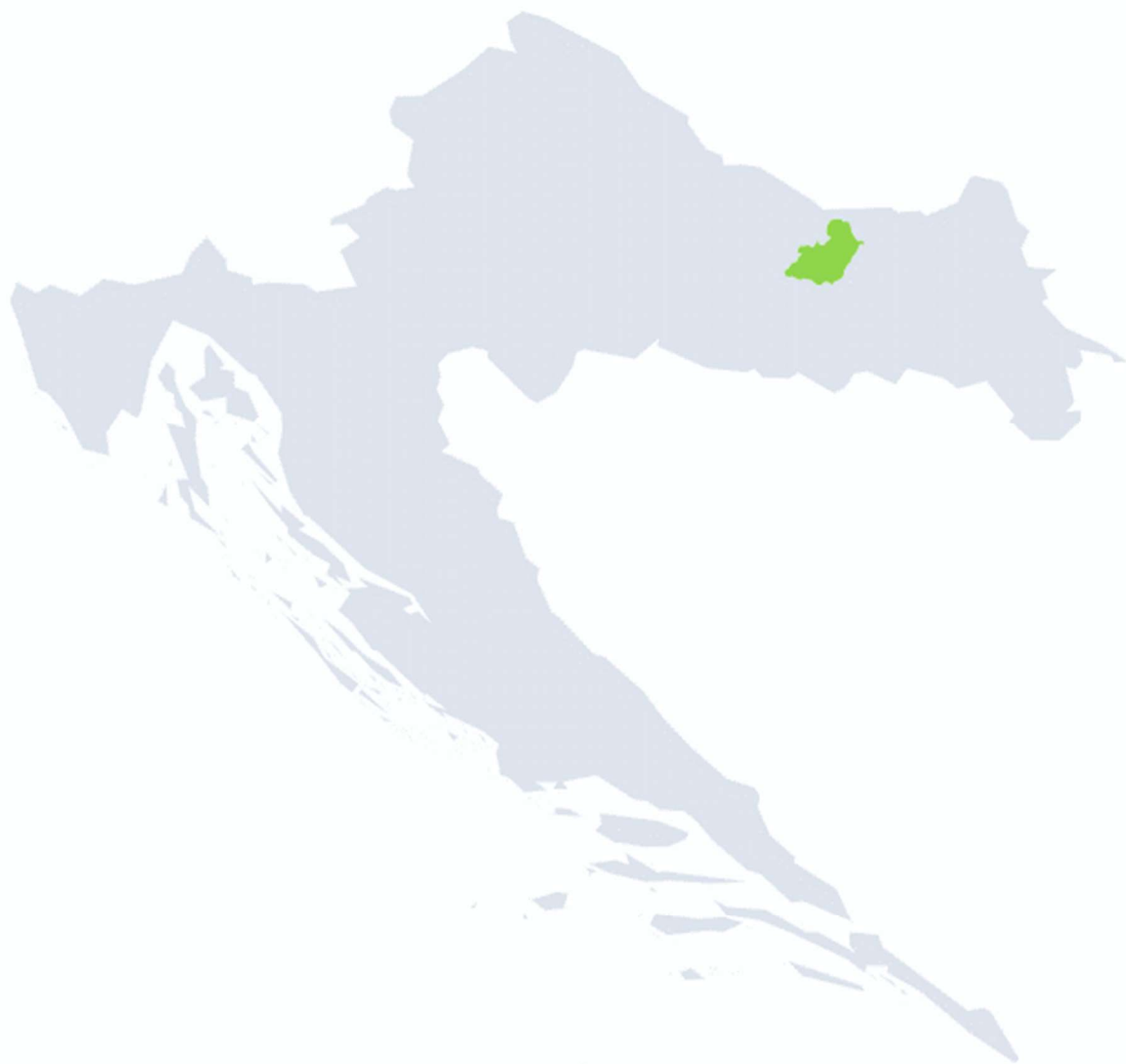
Slika 2: Karta položaja LAG-a na karti Republike Hrvatske